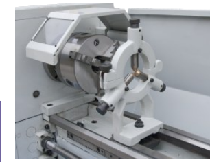
Lünette und Backenfutter