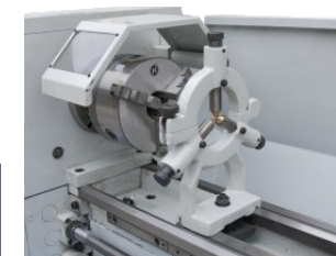
Lünette und Backenfutter